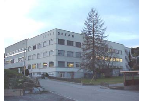
Zeitwirtschaft für über 1000 Mitarbeiter bei der Sefar Gruppe

der Sefar AG haben ihr Domizil in Rüslikon, wo ungefähr 70 Mitarbeiter/innen beschäftigt sind. In der Division Druck in Thal/Rheineck arbeiten ca. 350 Mitarbeiter/innen. Fast gleich viele sind es in der Division Filtration, mit Domizil im sanktgallischen Rheintal in Widnau/Heiden.