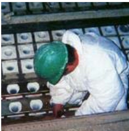
Innovation, Qualität, Zuverlässigkeit und Service - Ein Schlüsselbegriff für Sefar und die von ihnen ausgewählten Lieferanten

Mit dem Wechsel auf das Mobatime Produkt soll die Personalzeitwirtschaft auf eine neue effiziente Basis gestellt werden. Die hauptsächlichen Anforderungen die ans System gestellt wurden: Einfache, schnelle, dezentrale Zeiterfassung und Auswertung, dazu Datenaustausch mit Lohn- und Gehaltsprogramm, individuelle Parametrierungsmöglichkeiten sowie de-