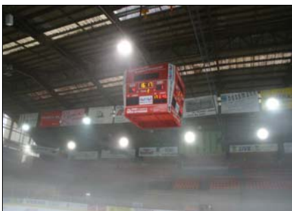
Das Nationalliga A Stadion in Langnau mit dem modernen vierseitigen Mobatime Würfel