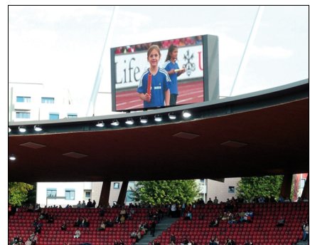
Stadion Letzigrund, Zürich Aussen ProStar Video Display