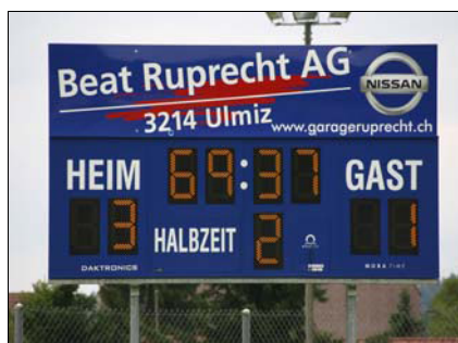
Daktronics Scoreboards von Mobatime Swiss AG

all eine überdurchschnittliche Leistung. Bei den grössten internationalen Sportanlässen wie den Olympischen Spielen, den Pan-amerikanischen- und den Commonwealth-Spielen vertrauen Organisatoren und Weltklasseathleten auf Daktronics.